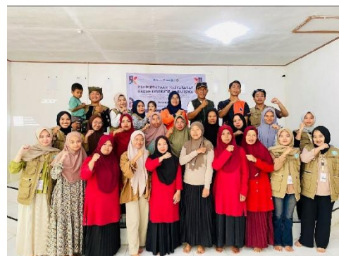
Gambar 2 Pelatihan Pemeriksaan Kesehatan Dasar dan Tanggap Bencana